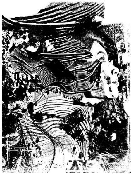
Alexandre Farto aka Vhils