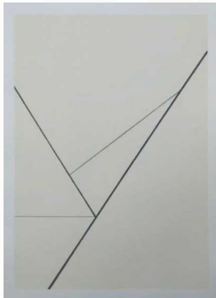
Zulmiro de Carvalho